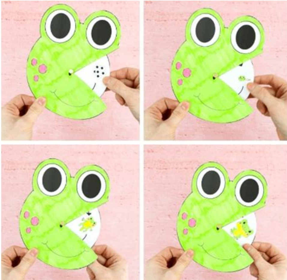
Forrás: A Life Cycle of a Frog Spinner | Arty Crafty Kids