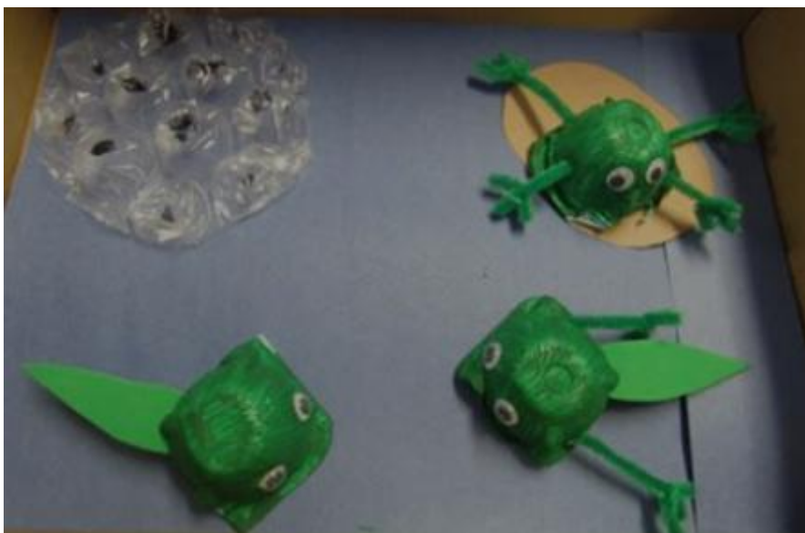
Forrás: Frog Life Cycle Craft for Kids | Still Playing School