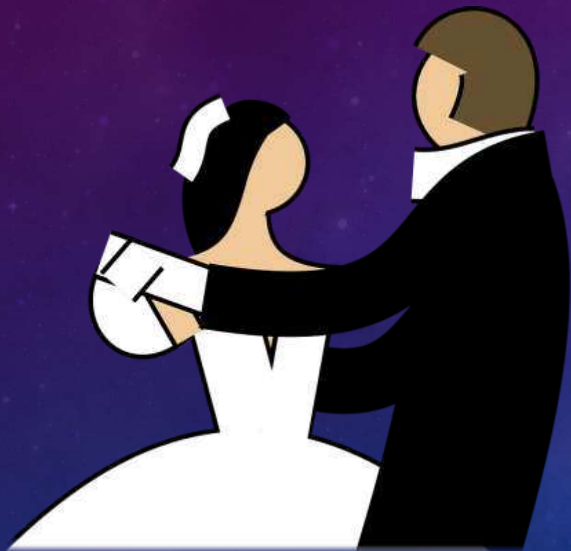
Egyetemista unokatestvér és vőlegénye